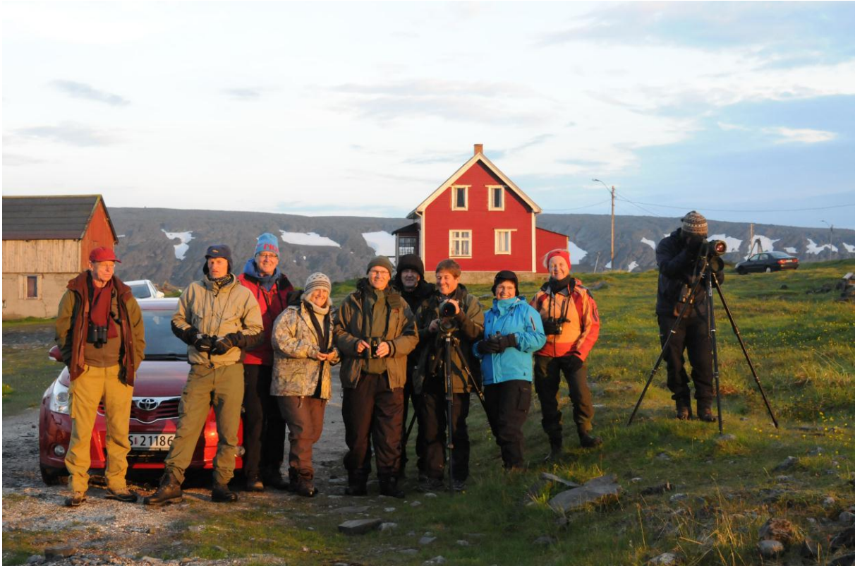
De fleste deltagerne samlet i det gamle fiskeværret Hamningberg - © Morten Günther.

I det gamle fiskeværret Hamningberg hadde vi bl.a. en nærgående rødrev, en havsule, en lappiplerke og noen vadere. En av deltagerne fikk også med seg en alkekonge som fløy forbi langs kysten.