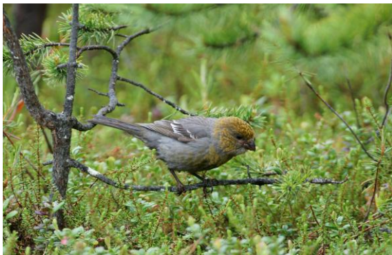
Konglebit ( Pinicola enucleator)