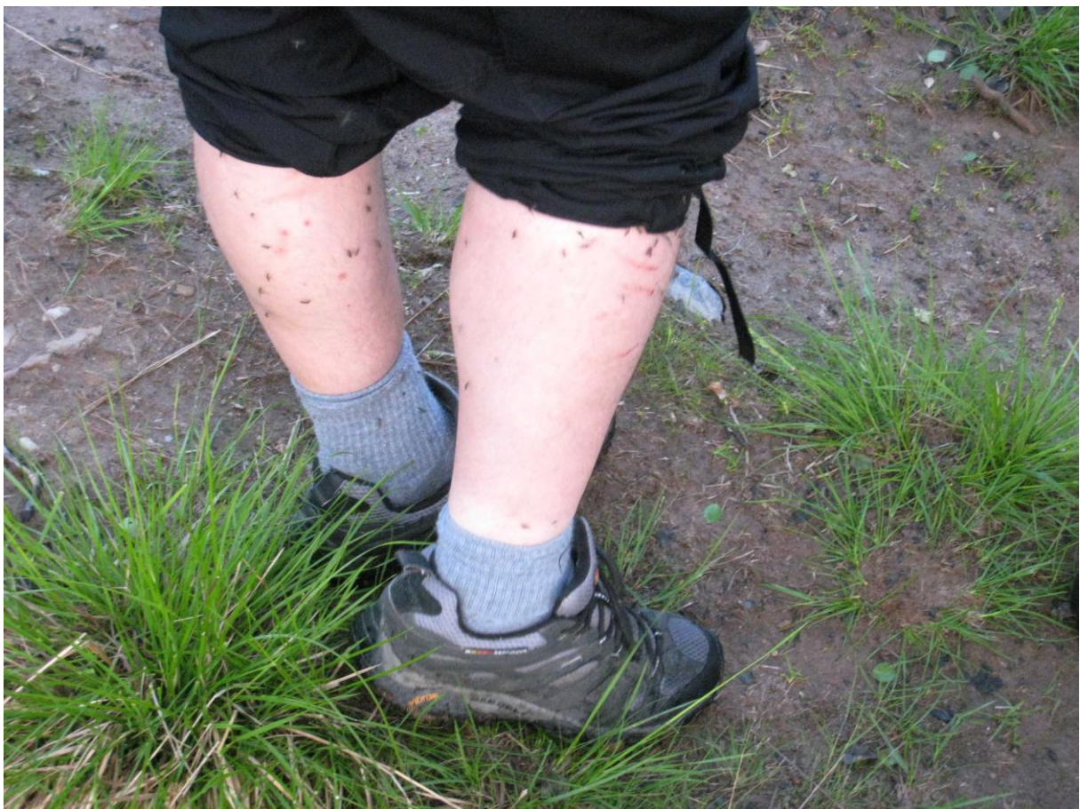
Mygg er ikke til å unngå i Øst-Finnmark sommerstid - © Ingvar Måge.

Takk til hver og en som bidro til en hyggelig tur! En ekstra takk til sjåførene for sikker kjøring og positiv innstilling!