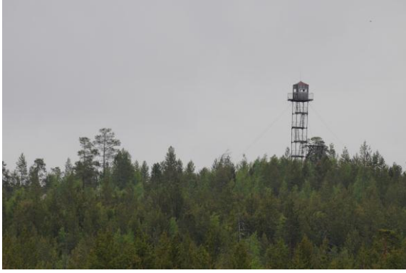
Russisk utsiktstårn ved Pasvikelva - © Morten Günther.