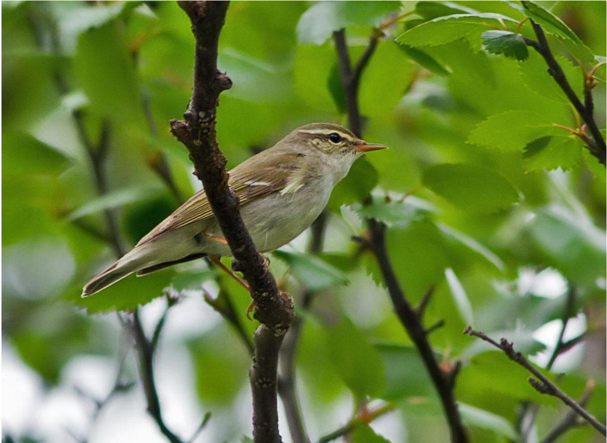
Lappsanger (Phylloscopus borealis)

1 ind. Sandfjord, Båtsfjord fra 24.06.2011 23:30 til 24.06.2011 23:50.