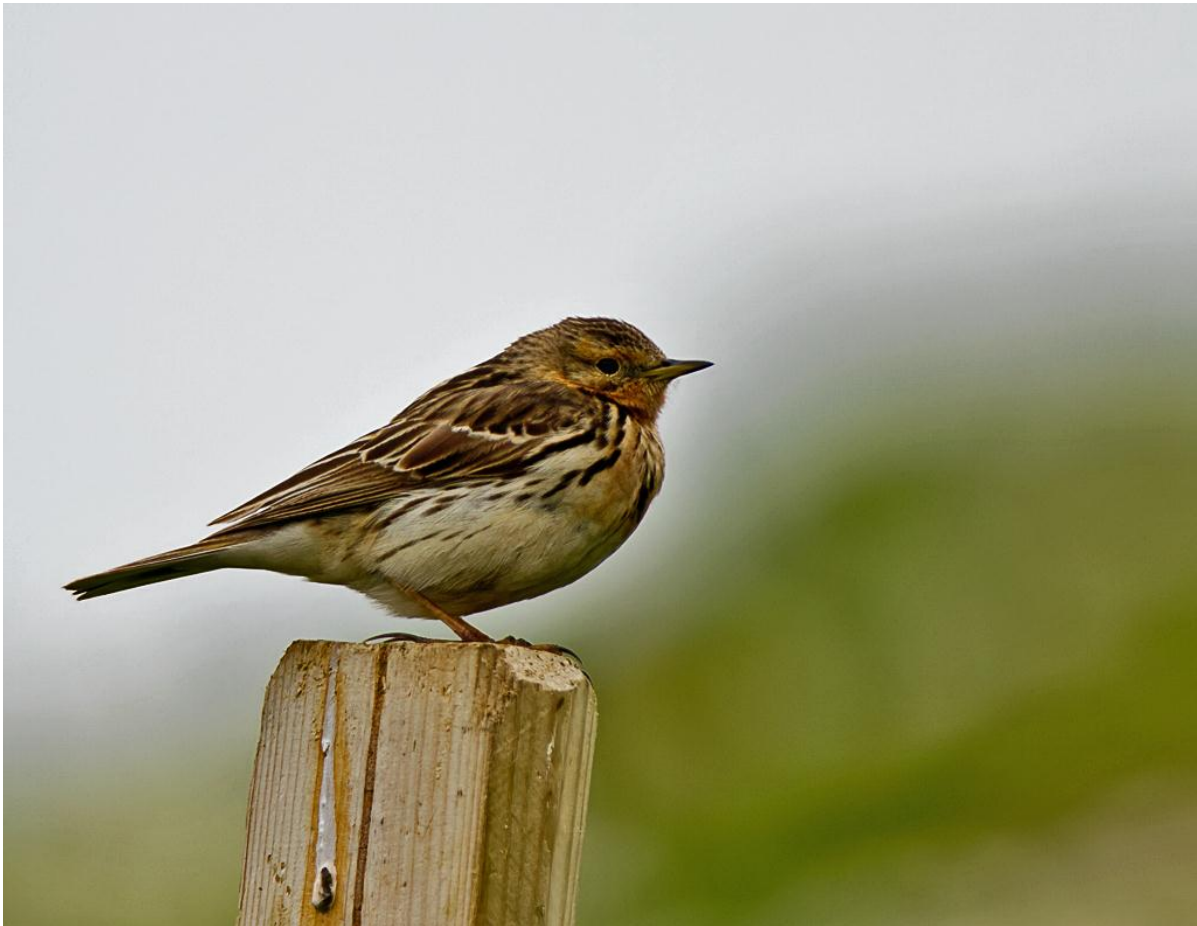
Lappiplerke ( Anthus cervinus )