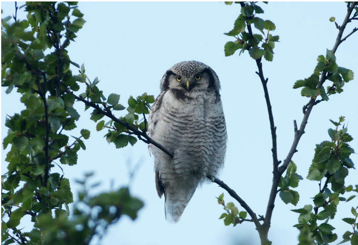
Haukugle ( Surnia ulula ) - © Ingvar Måge.

1 ind. Jakobselvdalen, Vadsø fra 23.06.2011 21:20 til 23.06.2011 21:55. Varslende. Trolig unger i nærheten.