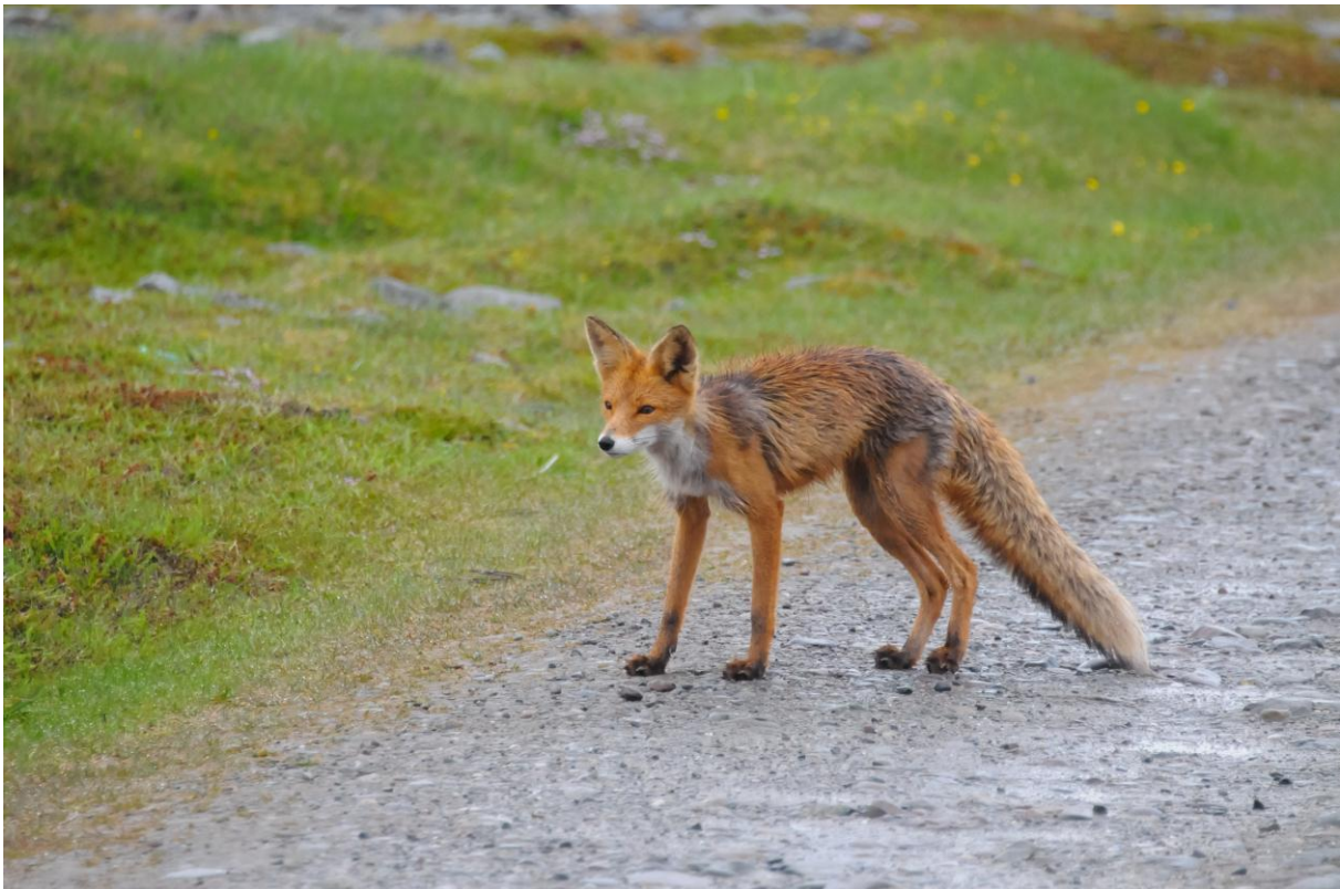
Rødrev ( Vulpes vulpes ) ved Hamningberg, Båtsfjord - © Morten Günther.

1 ind. observert ved Noatun, Sør-Varanger 21.06.2011 kl.13.30