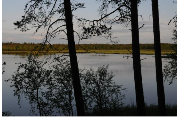
Parti frå Fjærvannet - © Morten Günther.