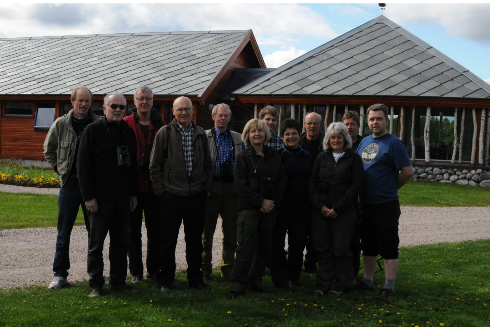
Turdeltagerne samlet ved Bioforsk Jord og miljø Svanhøvd - © Morten Günther.