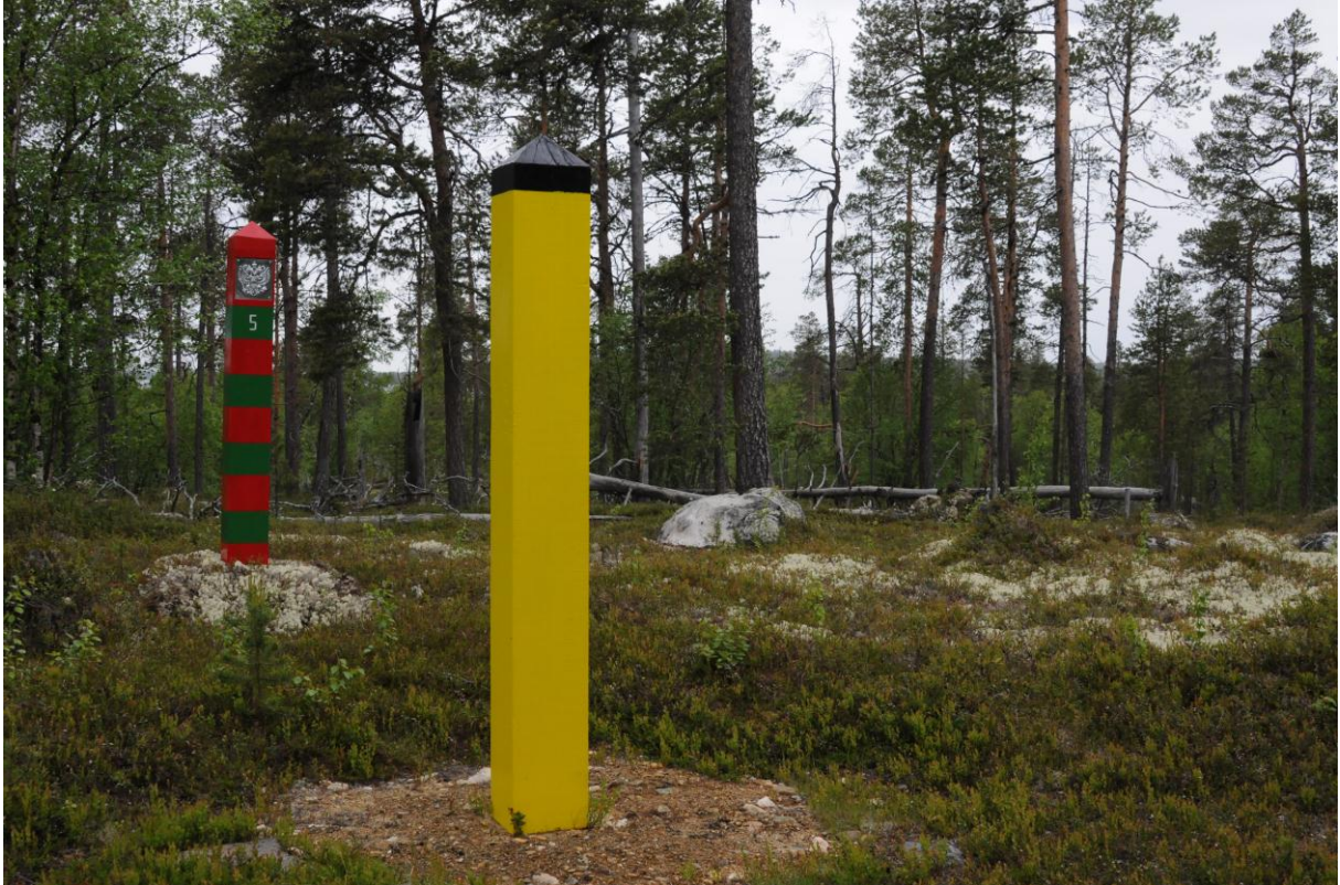
Grensestolper langs stien mot Treriksrysa - © Morten Günther.