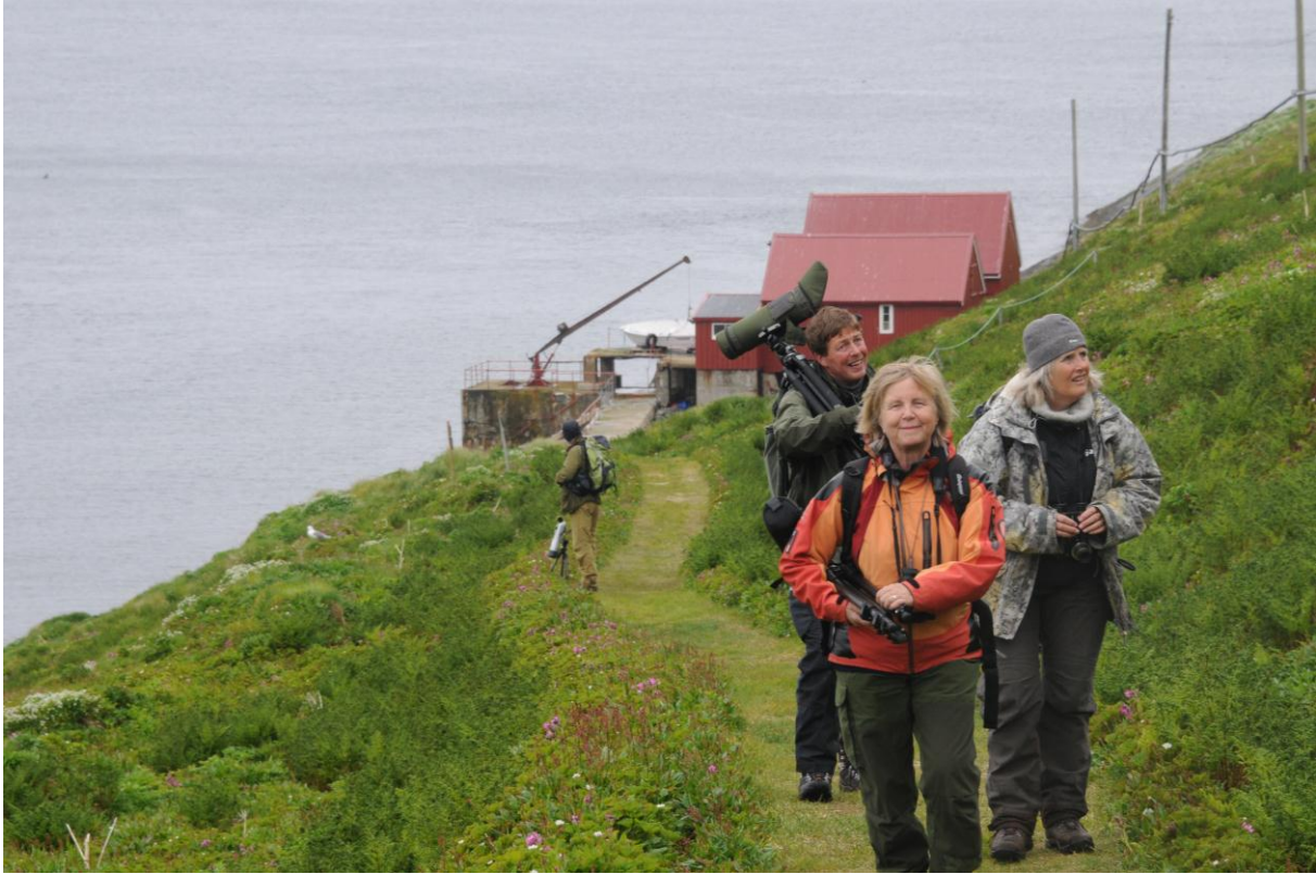
Turdeltagere på vei opp til fyret på Hornøya