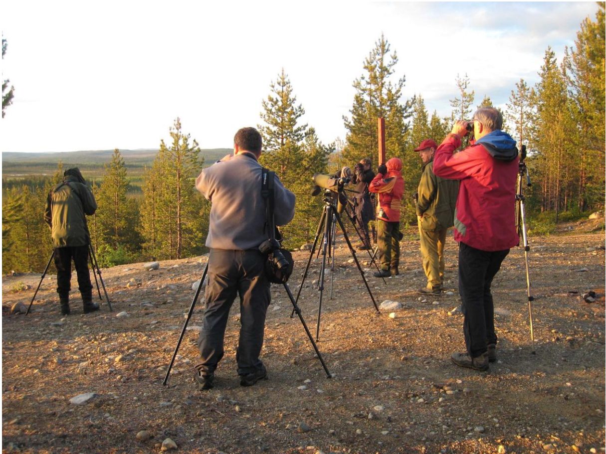
Spaning etter bjørn fra Blankvassåsen i Øvre Pasvik - © Morten Günther.

Nok en lappmeisfamilie ble oppdaget ved Svanetjørna sør for Nyrud. Her hadde vi også et par lavskriker til.