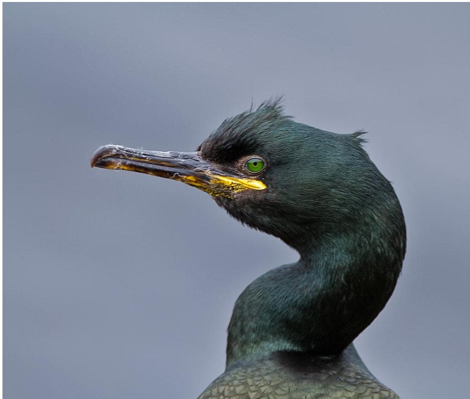
Toppskarv ( Phalacrocorax aristotelis ) - © Morten Nilsen.