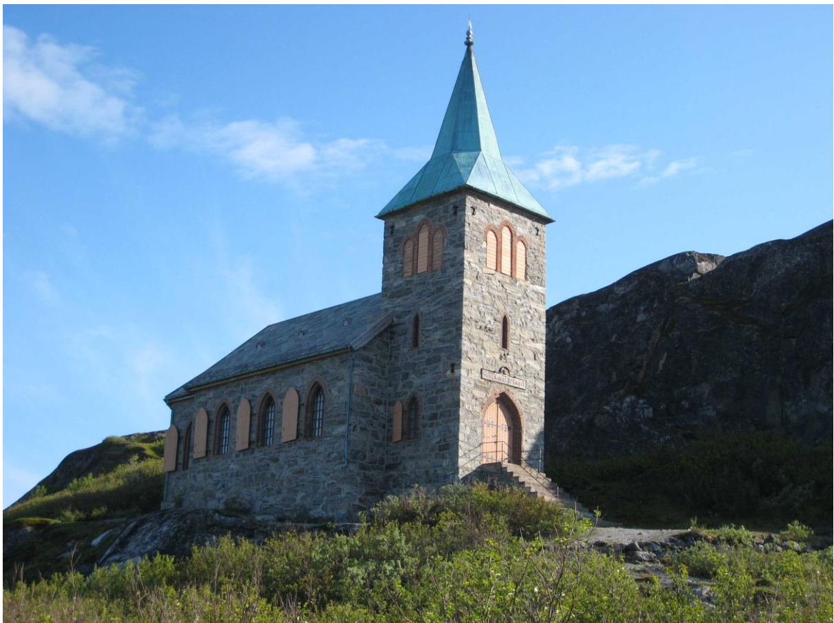
Kong Oscar II's kapell i Grense Jakobselv - © Sidsel Hetland.

Videre østover mot Grense Jakobselv fikk deltagerne stifte bekjentskap med en rekke av områdets karakterarter, men også turistattraksjoner som Kong Oscar II's kapell og grenseovergangen ved Storskog. En syngende gransanger hørtes ved Jarfjordbotn og en vakker blåstrupe ble observert ved Bjørnstad.