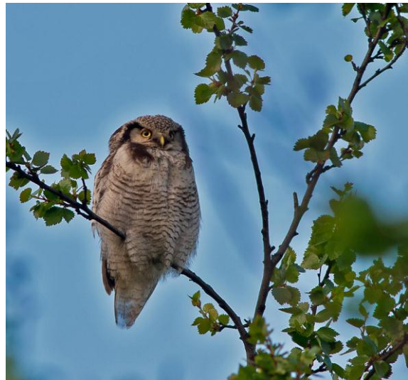
Haukugle ( Surnia ulula ) - © Morten Nilsen.