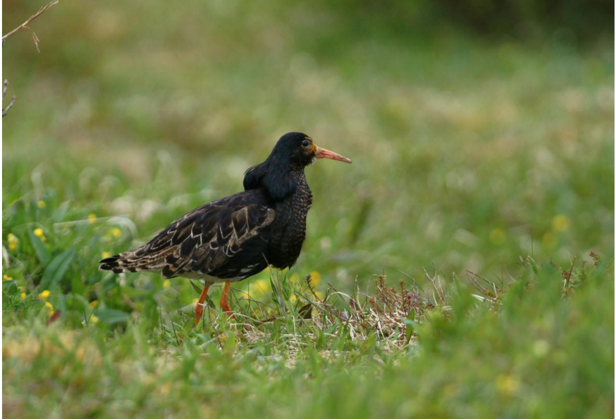
Brushane (Philomachus pugnax).