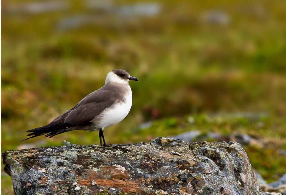
Tyvjo ( Stercorarius parasiticus )