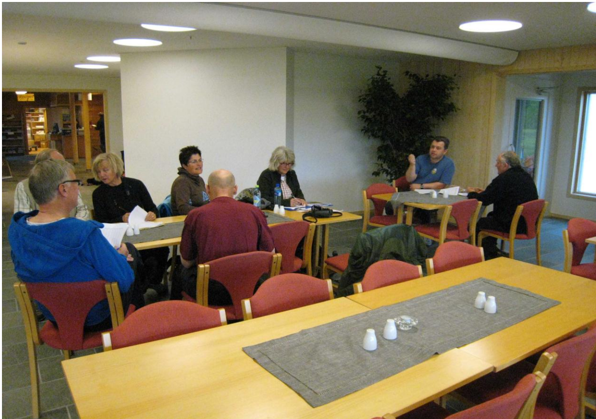
Gjennomgang av loggen ved Bioforsk Jord og miljø Svanhovd, Sør-Varanger - © Ingvar Måge.

Fra Noatun beveget vi oss sakte nordover langs skogsbilveien på Kjerringneset. Håpet var å få et glimt av en bjørnebinne med unger som var sett i området få dager tidligere. Det vi dessverre ennå ikke visste var at det også var et hekkende blåstjertpar i det samme området... Ved Jordanfoss fant vi en lappmeisfamilie med nylig utfløyne unger. Her hadde vi også et par storlom, til sædgås, en havørn, en dvergmåke og ikke mindre enn 140 næringsøkende rødnebbterner. Flere sandsvaer og et par gulerler holdt til i området ved elva.