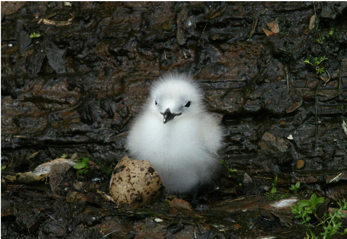
Krykkjeunge (Rissa tridactyla) - © Morten Nilsen.