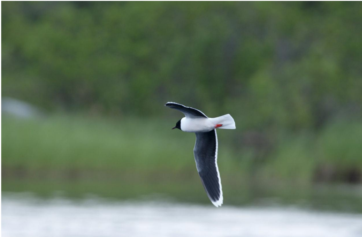
Dvergmåke (Larus minutus) i Pasvikdalen - © Ingvar Måge.