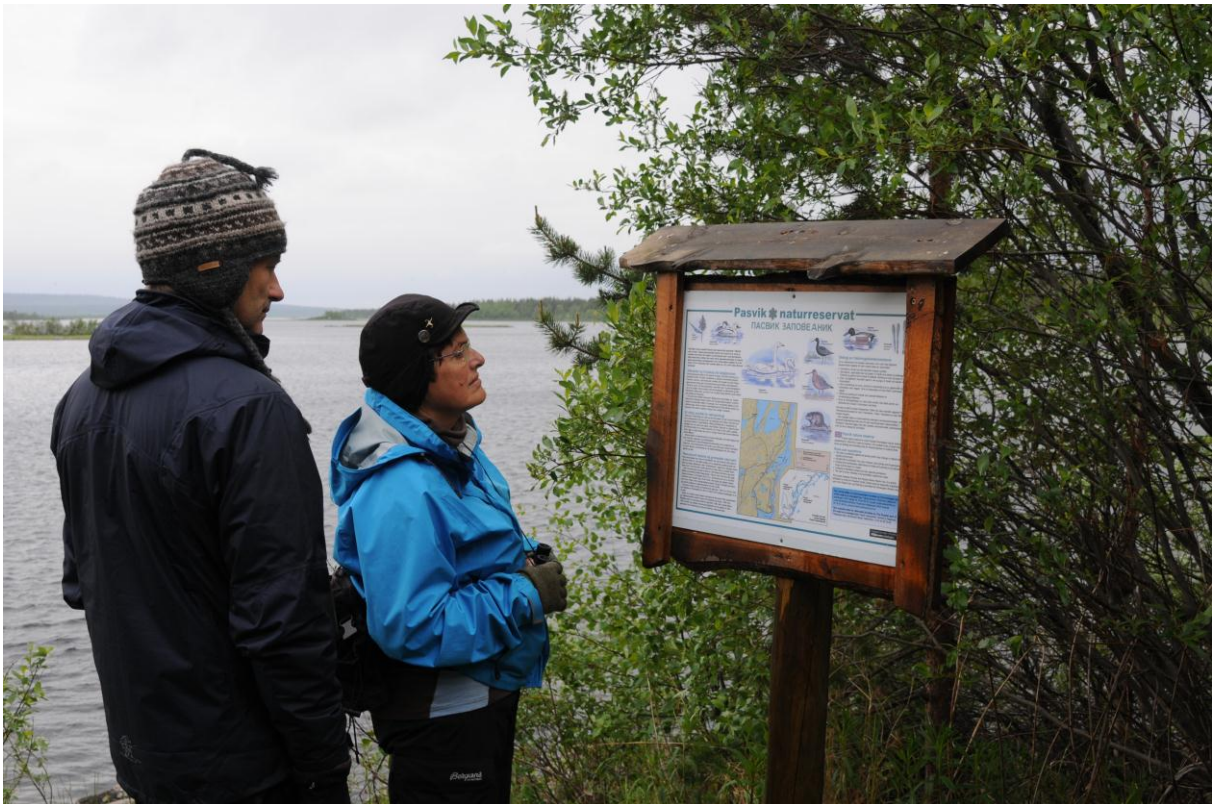
Informasjonstavle i Pasvik naturreservat.