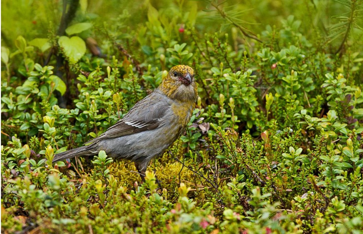
Konglebit ( Pinicola enucleator ) - © Morten Nilsen.