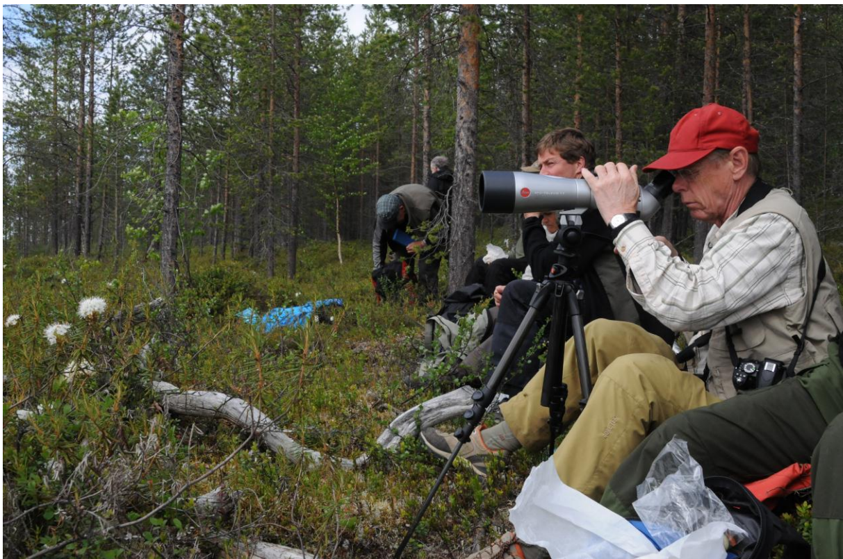
Lunsj ved Birrivarrajængæ