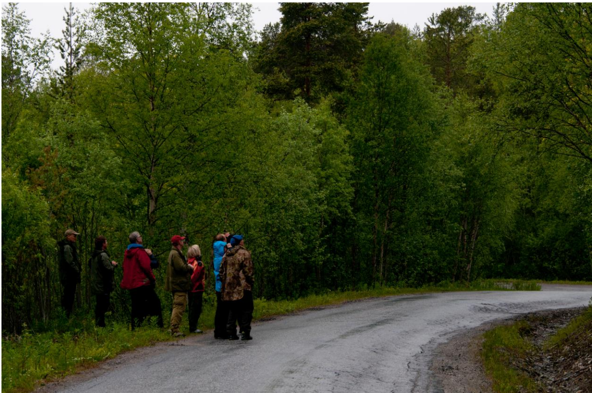
Nattlige studier av lappsanger i Pasvikdalen - © Morten Günther.

Ved midnatt tok vi en tur oppom Nittisekshøgda, men her var det ikke stort å se annet enn utsikten mot den russiske gruvebyen Nickel. En trane ble observert på Heiskarimyra og en gulspurv sang ved Pernillemyra. Dagens siste utflukt gikk til Strandveien noen kilometer nord for Svanvik. Her hadde vi ikke mindre enn fire syngende lappsangere innenfor et relativt lite område. Fuglene sang svært aktivt og et par av dem lot seg også studere på relativt kort hold. Andre interessante arter i området var bl.a. gjøk, rødstjert og måltrost. Lappsanger er en av de virkelige Pasvik-spesialitetene og det var en fornøyd gjeng som endelig kunne gå til køys kl.01:30.