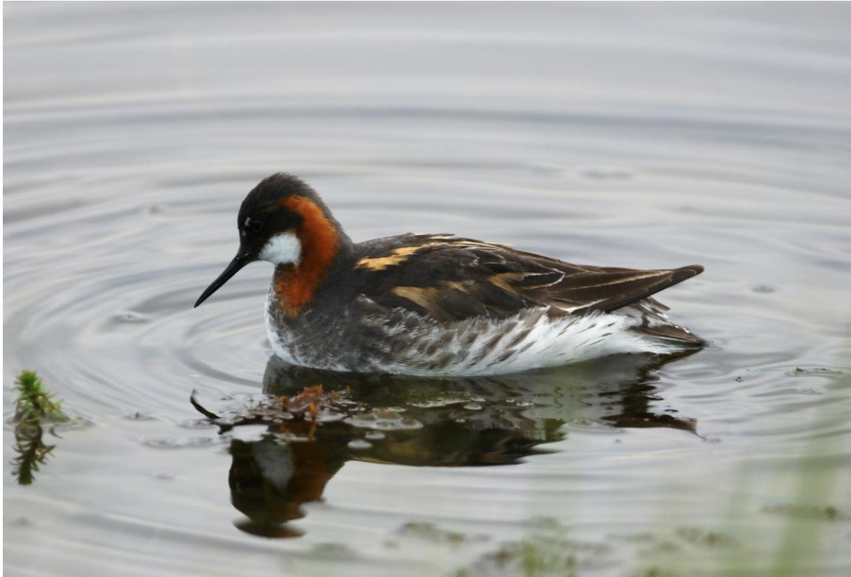
Svømmesnipe (Phalaropus lobatus) - © Ingvar Måge.

Nevnes må også tre dvergmåker som furasjerte i kveldssola nede i Vestre Jakobselv. Noen få par hadde gjort hekkforsøk på en holme i elva tidligere i sommer, men på grunn av oversvømmelse var reirene nå forlatt.