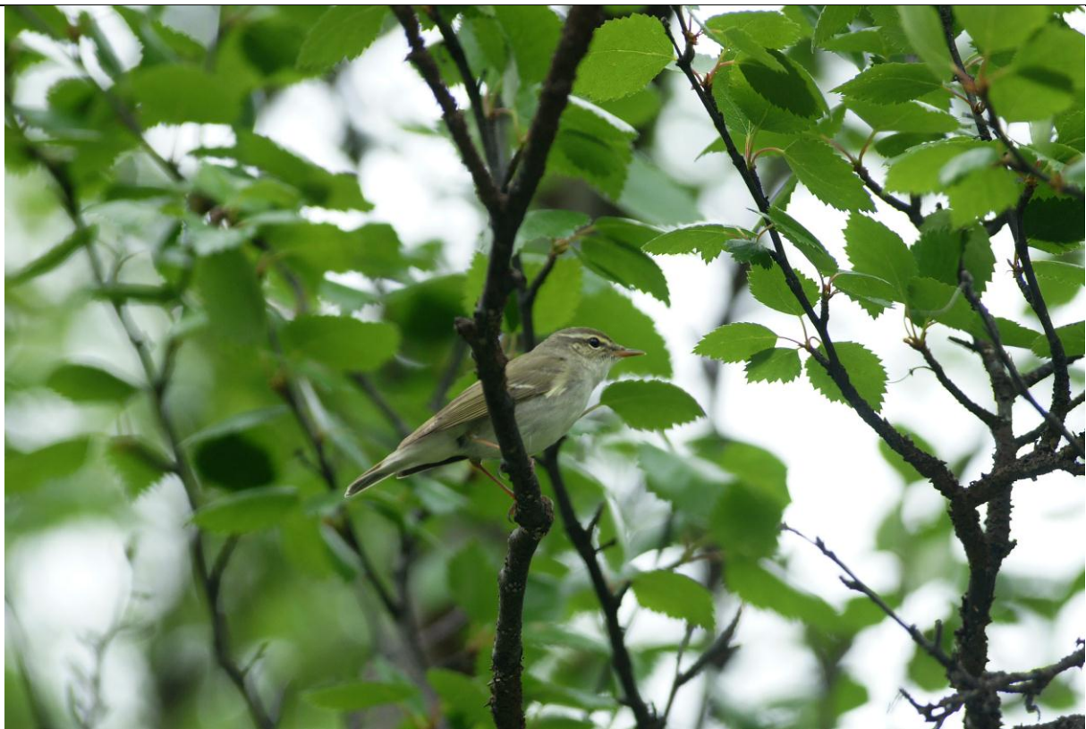
Lappsanger (Phylloscopus borealis) - © Ingvar Måge.