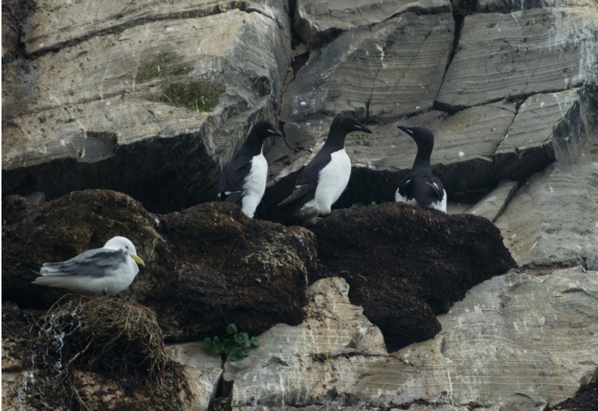
Polarlomvi (Uria lomvia)