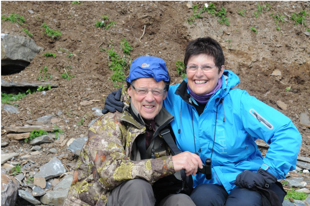
To av turdeltagerne på Store Ekkerøy - © Morten Günther.

Ved Store Ekkerøy gikk vi en tur langs stranden for å se på den store krykkjekolonien. Antall par har nok gått noe ned i de senere år, men fortsatt er det flere tusen par som hekker i kolonien. Vi fant en rekke fotomotiver både her og der. Trist var det imidlertid å konstatere at et betydelig antall døde og døende krykkjeunger hadde ramlet ned fra reirhyllene sine og lå fortapt i fjæra. I tillegg til krykkjene observerte vi et mindre antall alke og teist, et par skjærpiplerker, en steinskvett og to bergirisk.