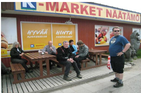
Shopping i Näätämö